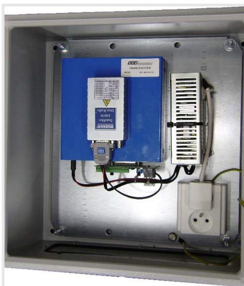
Pagingová stanice s kodérem a síťovým zdrojem